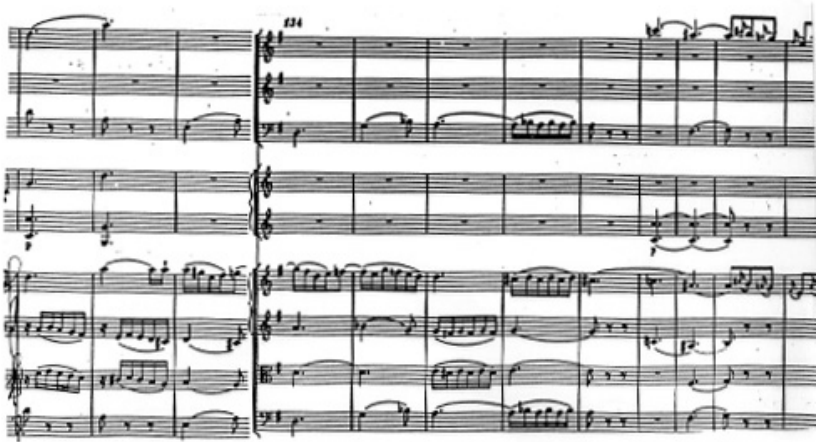
p) K.318 Mesures 131-138