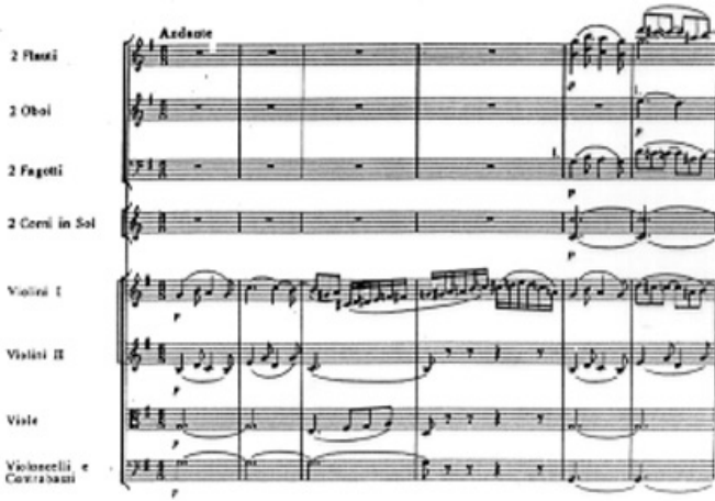
e. K.504 Symphonie « Prague » II e mouvement 1786

D'autres éléments apparaissent presque obligatoirement en accompagnant ce premier thème simple : les motifs dits de « la marche », apparentés à la figure rhétorico-musicale représentant la marche dans la musique baroque. 1 Ce motif de la marche se présente comme un élément de cadence ou de transition ou de thème dans presque toutes les œuvres évoquées.