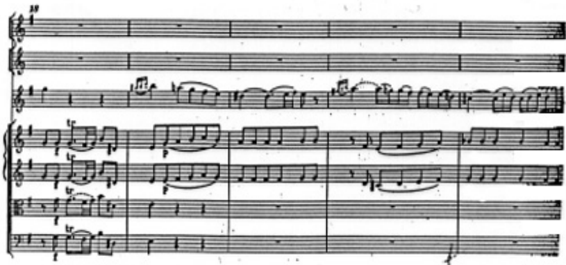
l) K.314 Transition Mesures 18-24