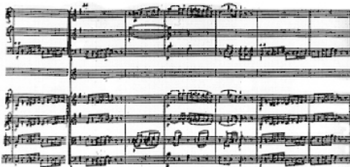
f) K.297 Thème 2 Mesures 23-24