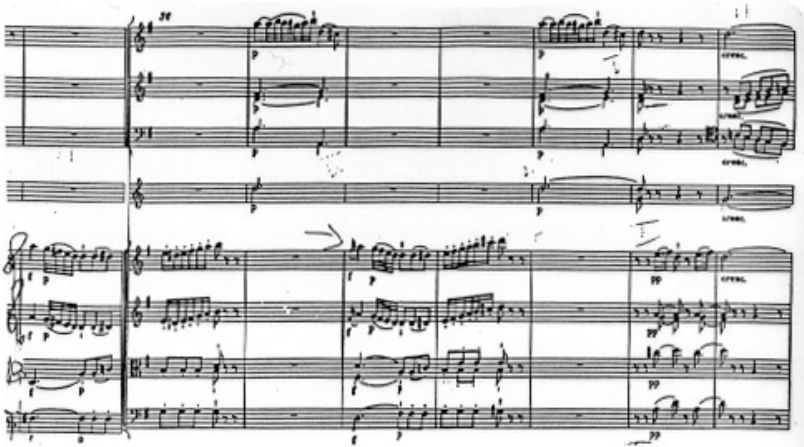
k) K.297 Thème 3 Mesures 35-44