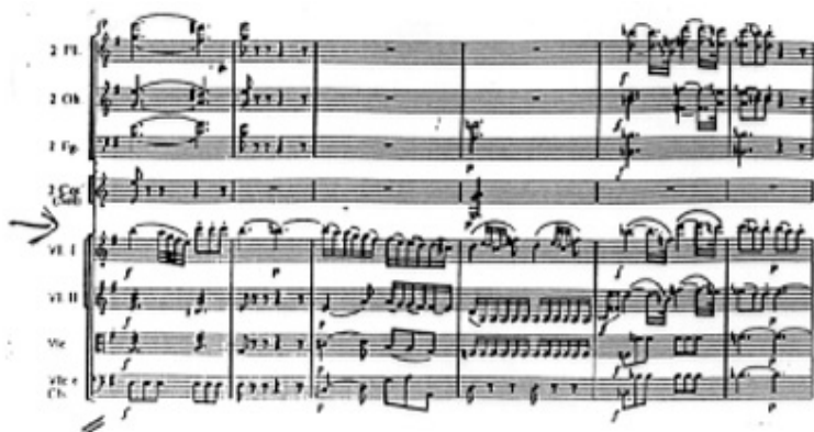
m) K.504 Transition Mesures 19-25

D'autres éléments récurrents et concomitants avec le premier sujet sont :