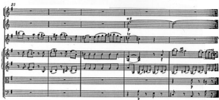
n) K.314 Mesures 23-27