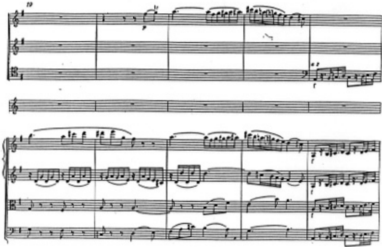
o) K. 314 Mesures 19-23